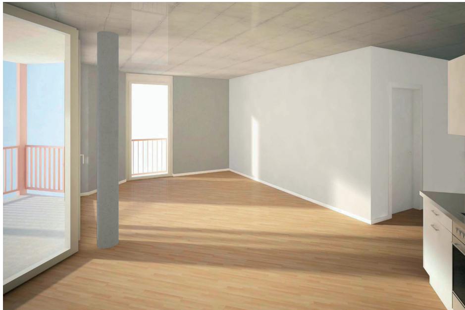
Visualisierung wild Baumanagement / Ramser Schmid Architekten

Sämtliche Materialien sind baubiologisch unbedenklich und erfüllen die Vorgaben nach Minergie-Eco.